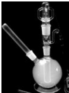
↑ Vaporizador Vs