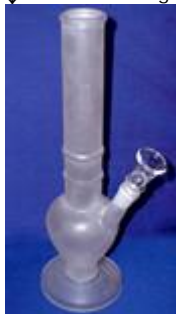
↓ Cachimbo de água